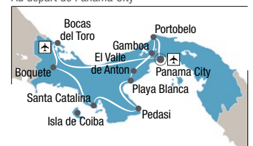
Au départ de Panama City

Jour 1 Panama City Accueil à l'aéroport de Panama City et transfert à votre hôtel.